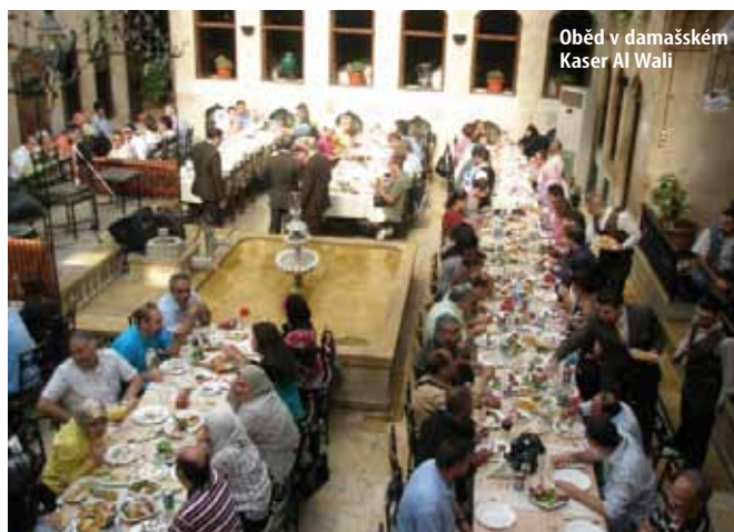
Oběd v damašském Kaser Al Wali

dolarů) jsou v průvodci Lonely Planet. Pokud pojedete do Sýrie za památkami, je téměř povinností navštívit po heřmánku a vavřínu vonící kosmopolitní Aleppo (Haleb) s citadelou, zaniklé starověké město Ugarit, římský amphitheater v Bosře, křesťanskou obec Ma`alula, ve které se dosud hovoří aramejsky (jazykem Ježíše Krista), nedobytný Saladinův hrad (UNESCO) a největší křižáckou pevnost na Blízkém východě Crack des Chevaliers. Stoupence památek nadchne Palmyra, starodávné město v poušti. Přímořská Latakia je stále vyhledávanějším turistickým lákadlem.