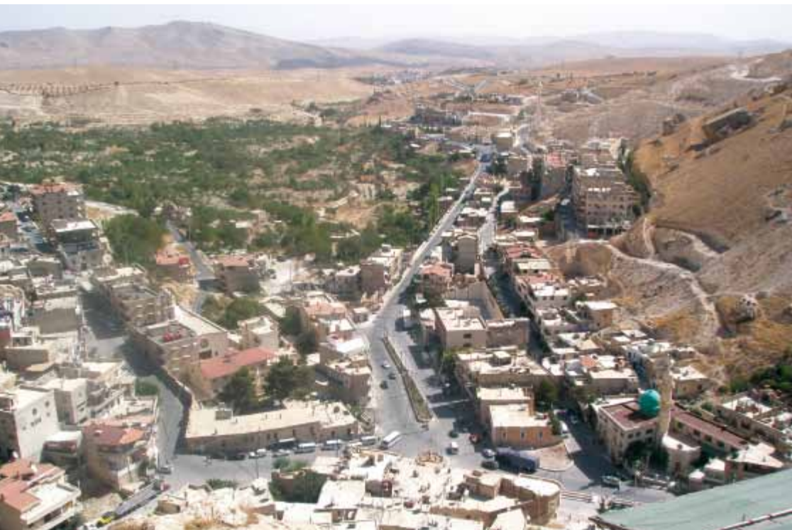
Název křesťanské vesničky Ma`alula, ohraničené zelenými políčky a fíkovými háji, je odvozen od aramejského „vstup“, zřejmě podle tamní bájně soutěsky. Nebýt antén a satelitů, mysleli byste, že jste se ocitli o pár století zpátky...

► tak bude i v den posledního soudu jako jediný ušetřený... Damašek je vsuktu krásný, plný překvapení. Arabsky Dimašk (hovorově aš-Šám) je údajně nejstarším, nepřetržitě obývaným městem na světě. Město „Dimašqa“ bylo dobyto Egyptany už v 15. století př. n. l. V krutých bojích se ho postupně zmocnili Aramejci, Asyřané, Peršané, Mongolové, Alexandr Makedonský, Římané a Turci. Všechny civilizace se podepsaly na stavební architektuře. Po I. světové válce okupovali město Francouzi. Po jejich odchodu byla 17. dubna 1946 vyhlášena nezávislost a Damašek se stal hlavním městem Sýrie.