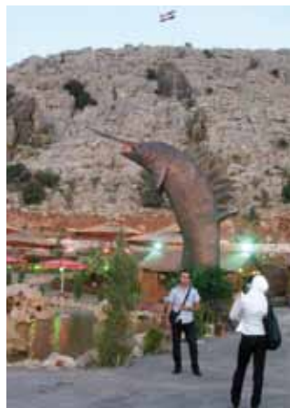
V porovnání s jinými zeměmi je pro nás orientální Sýrie prostorem spíše neznámým. Cestovní kanceláře ji v nabídce téměř nemají. A těch, kdo tam vyrazí na vlastní pěst, není mnoho.

Ve Starém městě uvidíte překrásné paláce i letité polorozbořené domy, natěsnané v úzkých uličkách. Jestli je něco, co neoddělitelně patří k Blízkému Východu, pak jsou to starobylá tržiště - sůky. Než se do dlouhých obchodních pasáží vydáte, naučte se smlouvat. Zajít si tam ale můžete nejen kvůli nákupu suvenyrů - doporučit lze např. oděv, vodní dýmku (k ní tabák vonícím po ovoci) nebo ručně vyráběná mýdla. Zázitkem je i pouhá procházka mezi obchůdky, v nichž pořídíte všechno -