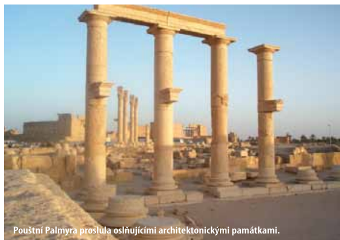
Pouštní Palmyra proslula oslňujícími architektonickými památkami.