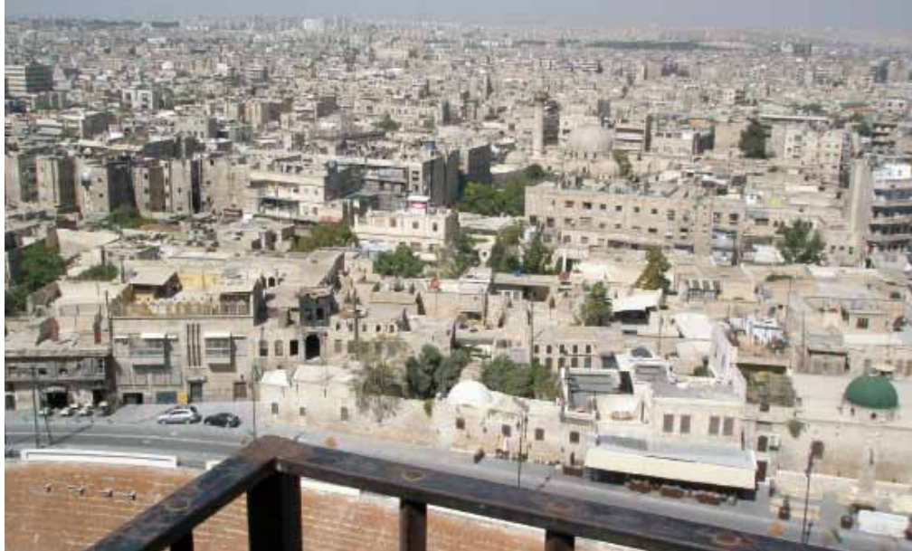
Allepo: Z hradeb pevnosti na pahorku je krásný výhled na jinak ploché město, se 3 miliony obyvatel druhé největší v Sýrii.

V létě tady panují vysoké teploty, lepší je přijet na jaře nebo na podzim. V zemi není moc kempů nebo hostelů. Tipy na levnější ubytování (cca 20