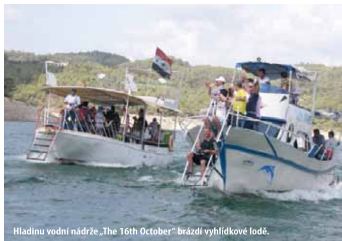
Hladinu vodní nádrže „The 16th October“ brázdí vyhlídkové lodě.